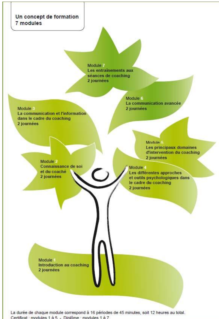
Schéma de la formation