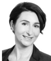
L. Soulat C. Directrice Link